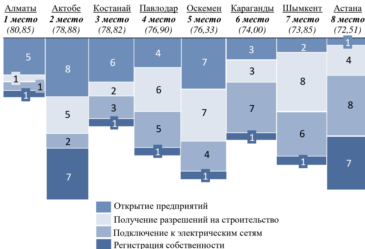
Диаграмма 3. Контрольные индикаторы «Субнационального рейтинга ведения бизнеса в Казахстане 2017»