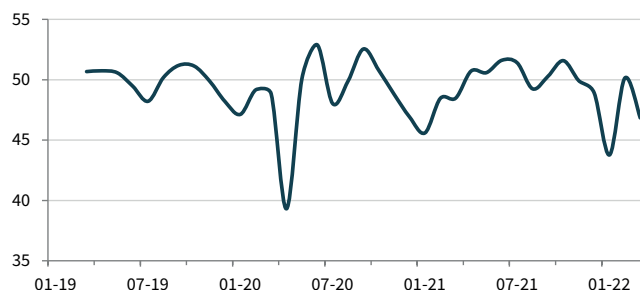
Tengri Partners PMI Обрабатывающих отраслей Казахстана ск, >50 = улучшение по сравнению с прошлым месяцем