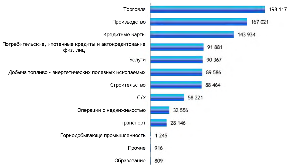
Кредиты, выданные клиентам, в разрезе отраслей ( млн. тенге) по состоянию на 30.09.2014 г.

Источник: Консолидированная финансовая отчетность Банка, СS