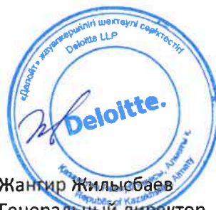
Жангир Жильисбаев Генеральный директор ТОО «Делойт»

Государственная лицензия на занятие аудиторской деятельностью в Республике Казахстан №0000015, вид МФЮ - 2, выданная Министерством финансов Республики Казахстан от 13 сентября 2006 г.