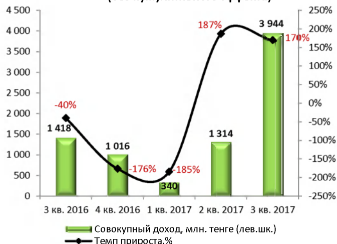
Динамика совокупной прибыли (без кумулятивного эффекта)