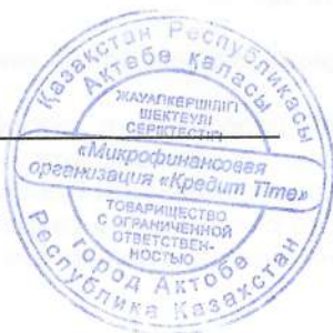
Есова А.С. Главный бухгалтер

Примечания на стр. 8-20 являются неотъемлемой частью настоящей финансовой отчетности.