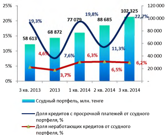
Качество ссудного портфеля (НБРК)