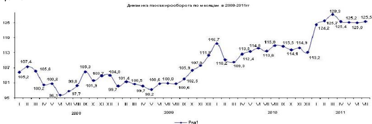
Динамика пассажирооборота по месяцам в 2008 - 2011 гг. Диаграмма 2.

В сравнении с аналогичным периодом 2010 г., наблюдается значительное увеличение объемов пассажирооборота.