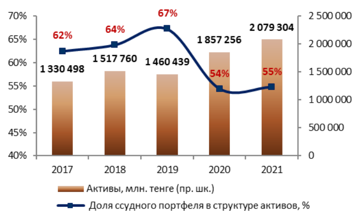
Доля судного портфеля в структуре активов (МСФО), %