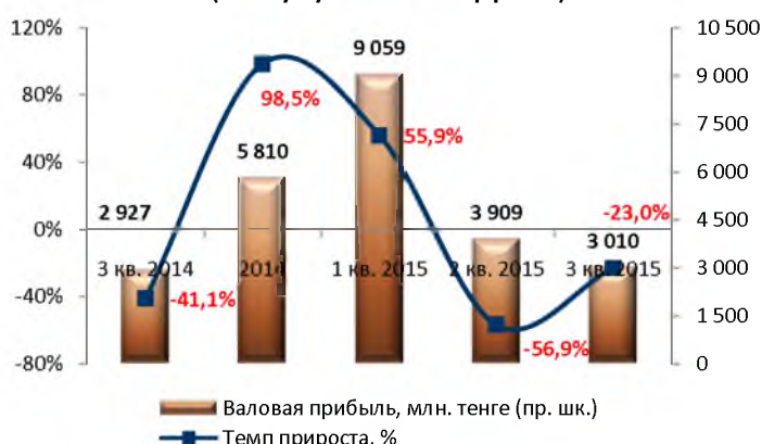
Динамика валовой прибыли (без кумулятивного эффекта)

• По итогам 2014 г. Эмитент провел переоценку основных средств.