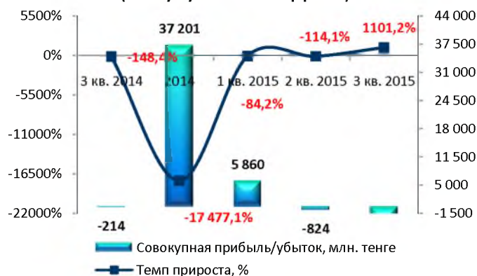
Динамика чистой прибыли / (убытка) (без кумулятивного эффекта)