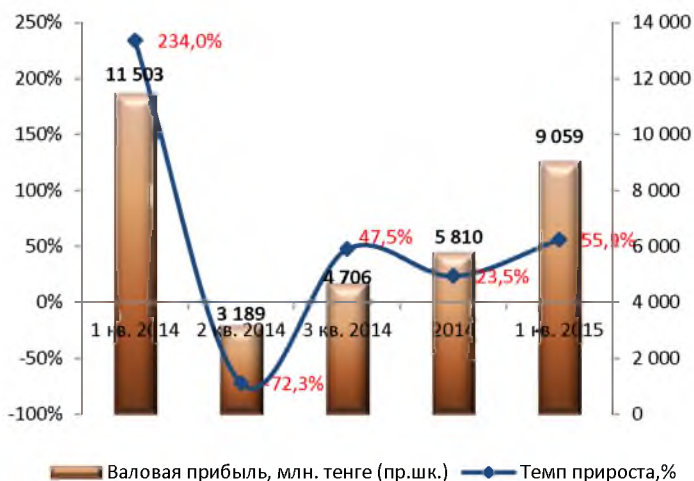
Динамика валовой прибыли (без кумулятивного эффекта)