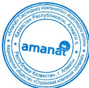
Нурғалиев Е. Б.