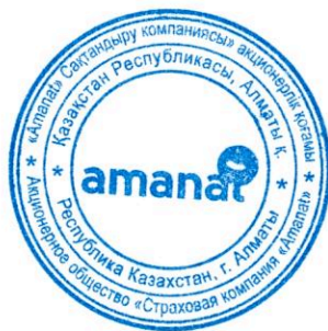
Нурғалиев Е. Б.