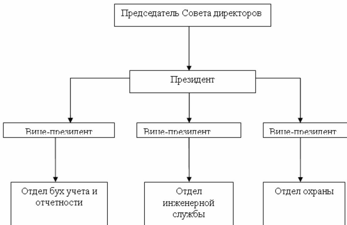
Приложение 1: Схема организационной структуры АО «Алматытемір»