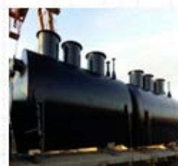
Емкости и силосы