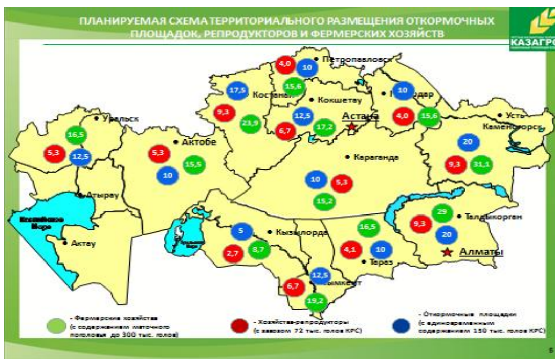
Рисунок 4 – Планируемая схема территориального размещения откормочных площадок, репродукторов и фермерских хозяйств

Разработана прогнозная схема территориального размещения откормочных площадок, репродукторов и фермерских хозяйств (схема является прогнозной, подлежит уточнению с учетом возможных изменений ситуации (бизнес-активность, потенциала региона, эпизоотической ситуации и т.д.) (Рисунок 4).