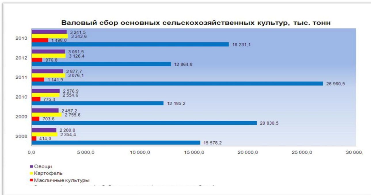
Рисунок 1 – Валовый сбор основных сельскохозяйственных культур, тыс. тонн