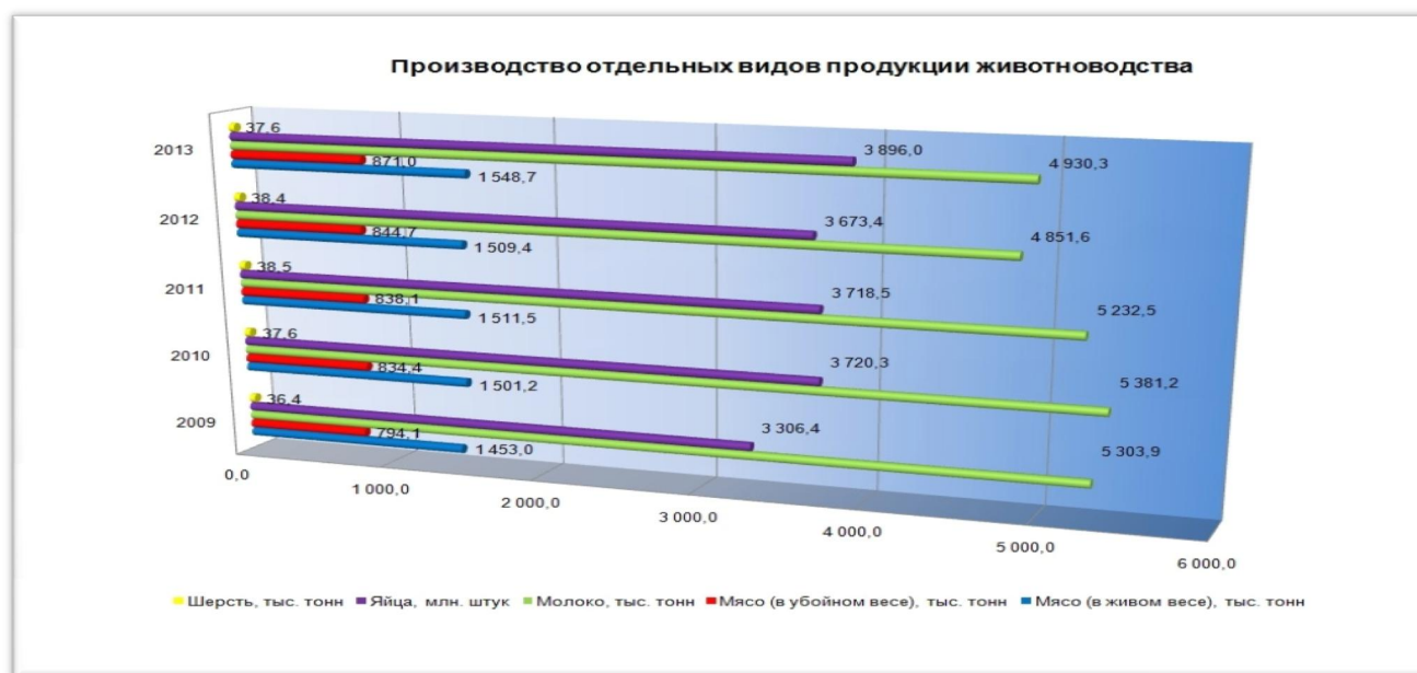
Рисунок 2 – Производство отдельных видов продукции животноводства

По итогам 2013 г. производство мяса в убойном весе во всех категориях хозяйств составило 871,0 тыс. тонн (в том числе 389,6 тыс. тонн говядины, 156,3 тыс. тонн баранины, 99,9 тыс. тонн свинины, 89,4 тыс. тонн конины и 135,8 тыс. тонн мяса птицы), что по сравнению с прошлым годом увеличилось на 3,1%, производство молока на 1,6% и составило 4 930,3 тыс. тонн, яиц – соответственно на 6,1% и 3 896,0 млн. штук. Производство шерсти уменьшилось на 2,1% и составило 37,6 тыс. тонн. В динамике производство животноводческой продукции за 2009-2013 гг. представлено на рисунке 2.