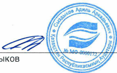
Адил Сыздықов Аудитор

Аудитордың 2013 жылғы 23 желтоқсандағы № 0000172 біліктілік куәлігі