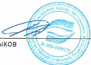
Адиль Сыздыков Аудитор

Квалификационное свидетельство аудитора № МФ - 0000172 от 23 декабря 2013 года