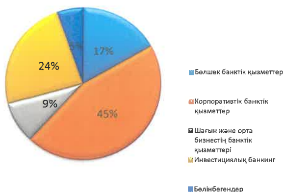
Сегменттік активтер жиыны 2022 ж. 31 желтоқсан