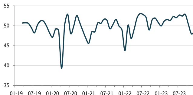
Tengri Partners PMI® Обрабатывающих отраслей Казахстана ск. >50 = улучшение по сравнению с прошлым месяцем