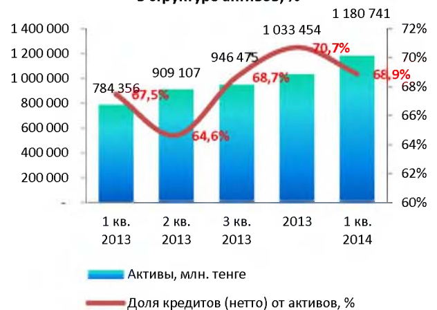
Доля ссудного портфеля в структуре активов, %