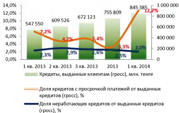
Качество ссудного портфеля

Незначительные расхождения между итогом и суммой слагаемых объясняются округлением данных.