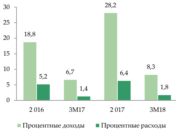
Динамика процентных доходов и расходов (в млн. тенге)